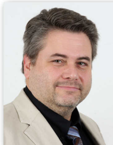
Institut für Politikwissenschaft an der RWTH Aachen